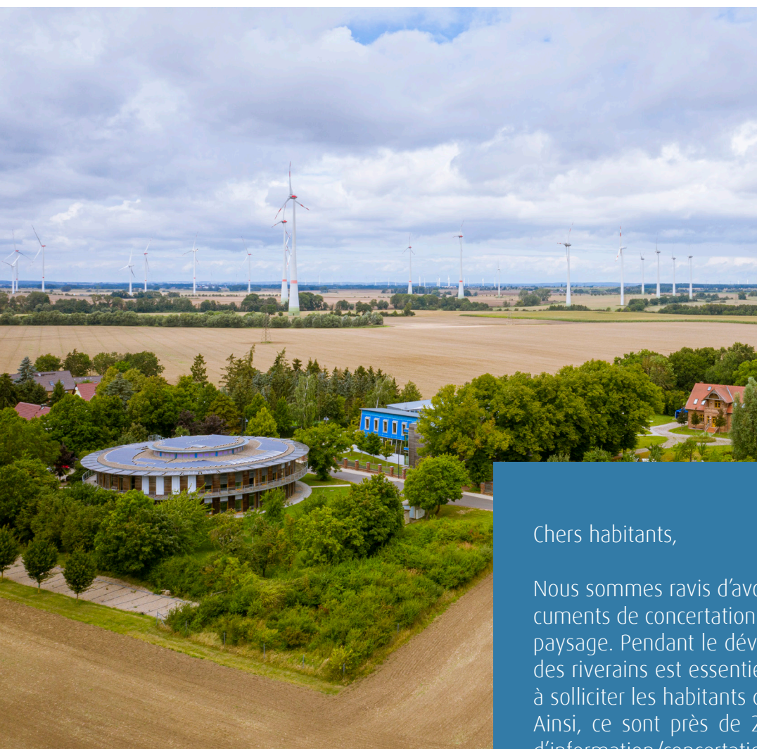
Siège d'ENERTRAG à Dauenthal, Allemagne

RÉSULTATS DE LA CONCERTATION À DISTANCE SUR LE THÈME DU PAYSAGE